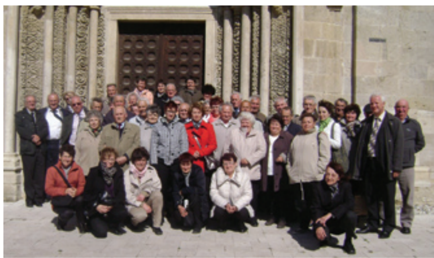
Kiseški vjerniki u Lébény-u pred crkvom Sv. Jakova

A győri bazilika „Vérrel könnyező Szűzanya” kegyképéhez indult a kőszegi hívők egy csoportja a 42. horvát zarándoklatra május 4-én. Az Országos Horvát Önkormányzat idén ugyancsak ezt a helyet jelölte ki az Országos Horvát nap zarándokhelyeként. A közös szentmisét és ebédet követően hazafelé a kőszegiek megtekintették az országosan ismert lébényi templomot is.