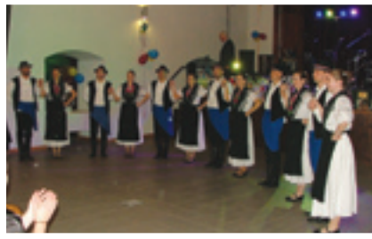
Židanski tancoši HKD „Čakavci“ zahvalu se zadovoljnoj publiki

se jutrašnji lampuši važi gati na neki ubloki kada su se zadnji gosti krenuli k domu.