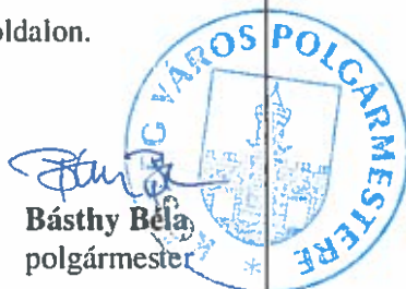
Básthy Béla Básthy Béla polgármester