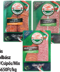
Privát Hús Vastagkolbász Csemege/Csipős/Mix Vg. 60g, 6650Ft/kg