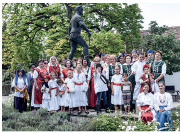
Hrvatska četa pred kipom Nikole Jurišića

A Kőszegi Horvát Önkormányzat a kezdetektől vesz részt az „Ostromnapok” történelmi eseménysorozatban. A „Zora” nemzetiségi énekkar dalaival, a „Vitézi próba” játékos