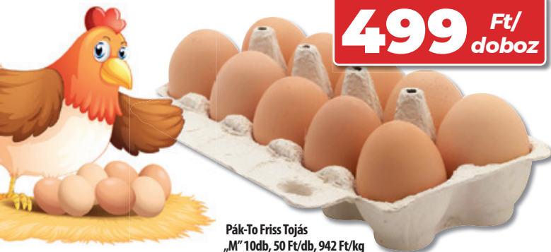
Pák-To Friss Tojás „M” 10db, 50 Ft/db, 942 Ft/kg