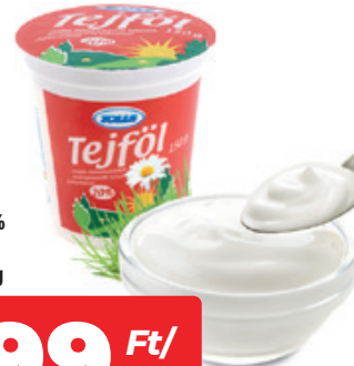
Tolle Tefjöl 20% 150g, 1327 Ft/kg