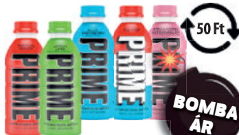
Prime Hydration Drink Tropical Punch / Lemon Lime / Blue Raspberry/ Ice Pop / Strawberry Watermelon 0.5L 1798 Ft/l