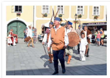
Peljači hrvatske grupe

Historijskom igrom se spominjaju i ljetos u Kisegu na povijesni događaj 1532. ljeta, kada je hrvatski plemić, diplomat i vojskovođa Nikola Jurišić uspješno branio Kiseg protiv strašno velike turske vojske. Na ovoj povijesnoj igri od početka (2007.) sudjeluju i kiseški Hrvati. Na početku kot branitelji tvrdjave, a u ulogi Jurišića sa Šandorom Petkovićem, predsjednikom HS u Kisegu. Organizatori su usput malo prominjali sudjelovatelje ove igre, sadržajno i atraktivno su širili programsku ponudu ali kiseški Hrvati čuvaju hrvatsku liniju ovoga događaja. Petak 2. augustuša predvečer u 19 uri na Jurišćevom trgu hrvatskimi jačkami je začarao publiku pjevački zbor „Zora”, - za kim se je počela i voljena plesačnica. Drugi