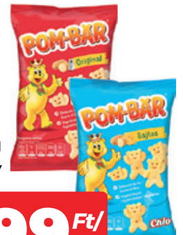
Chio Pom Bar Original / Sajtós 50g, 7980 Ft/Kg