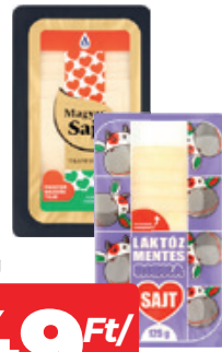
Szeletelt Trappista Sajt Magyar / Riska Laktózmentes 125G 5192 Ft/Kg