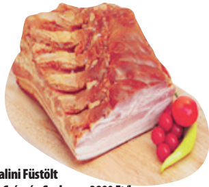
Új Palini Füstölt Főtt Császár Szalonna 3890 Ft/kg