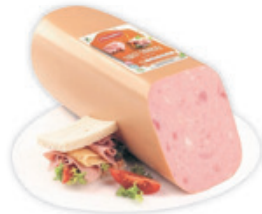
Finonimo Baromfi Toast Sonkás Szelet 2990 Ft/Kg