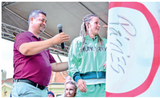
A városháza falán, a kivetítő mögött függött Luca második meccse alatt az olimpiai zászló, amit az olimpiáknak a kőszegi köszöntésekor átadott a polgármester

66 kilogrammos súlycsoportjában. Luca ezzel saját gyermekkori álmát teljesítette. Hihetetlen szorgalommal és alázattal, pontosan követte a siker forgatókönyvét, amelyet egy évvel ezelőtt a kvótaszerzés idején így fogalmazott meg: „Meccsről