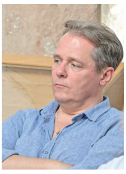
Őze Áron rendező.

Az előadás előtt már délután gondosan előkészítve várták „szerepüket” a kellékek, a lazacfatatok, a helyi sportklubtól kölcsönkapott tenisz-