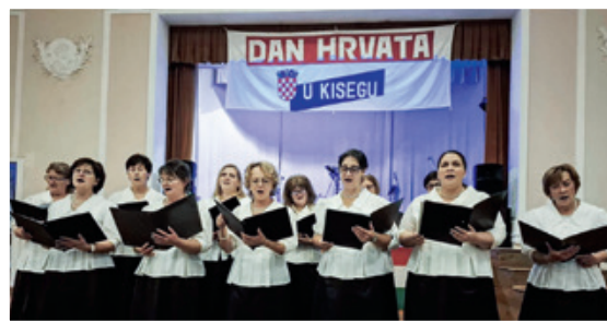
Pjevački zbor „Lastavica” iz Narde je muzički oblikovala Hrvatski dan pred vičerom