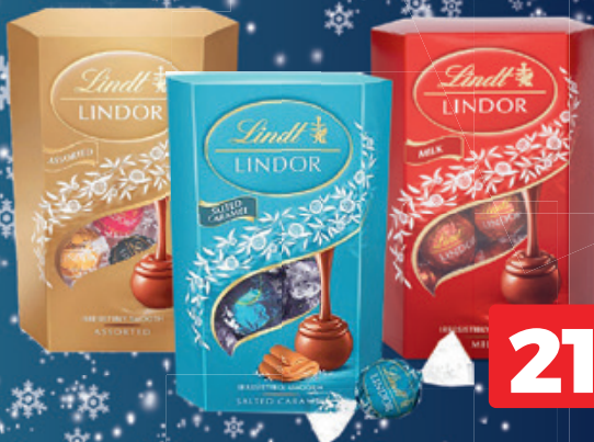
Lindt Lindor Golyó Milk Tejszoki Dd/ Assorted Vegyes/ Sós Karamell-Tej 200g, 10995 Ft/kg