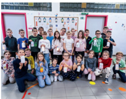
Kinder aus der Balog Schule