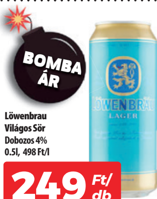
Löwenbräu Világos Sör Dobozos 4% 0.5l, 498 Ft/l