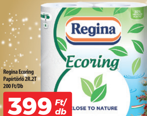
Regina Ecoring Papírtörő 2R.2T 200 Ft/Db