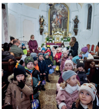
III. Sankt Martin- Lampion-Umzug in Schwabendorf