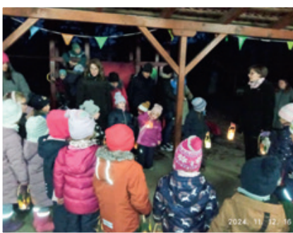
Martin-Tag im Günser Kindergarten