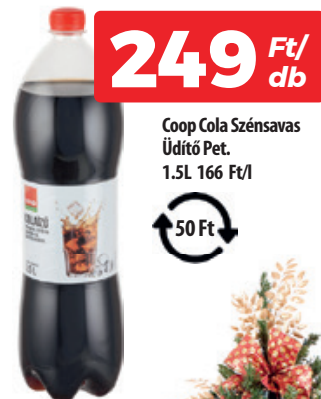
Coop Cola Szénsavas Üdítő Pet. 1.5L 166 Ft/l