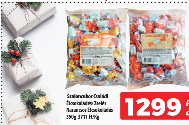
Szaloncukor Családi Étsokoládés/ Zselés Narancsos Étsokoládés 350g 3711 Ft/Kg