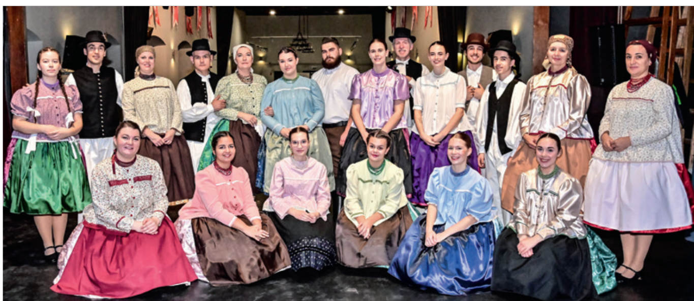
A jelenleg aktívan működő Bázis csoport