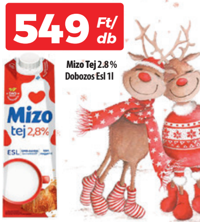
Mizo Tej 2.8% Dobozos Esz 1l