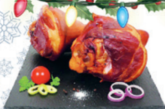
Privát Hús Füstölt Hátsó Csülök 2690 Ft/kg