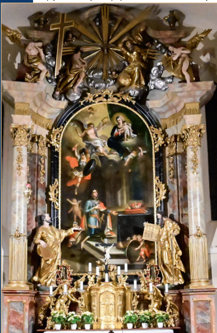
A SZENT IMRE-TEPLOM FŐOLTÁRA