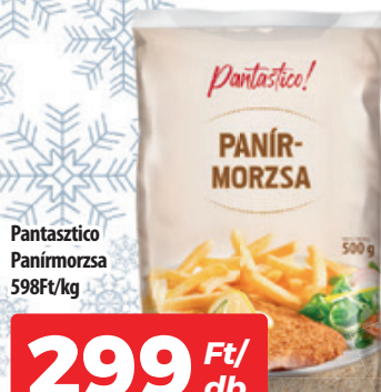
Pantasztico Panirmorzsa 598Ft/kg