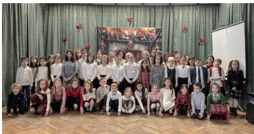
U Hrvatskom Židanu četrdeset i šest dice je recitiralo pjesmice

dičji naraštaj upeljati u hrvatsku kulturu. U Hrvatskom Židanu 17. decembra mjesna osnovna škola sa niži razredi organizirala je već tradicionalni „Božićni recital”. Prijavilo se je 46 dice iz Jursko – mošonsko – šopronske i Željzanske županije. Izabrana tema bila je zima i zimski svetki. U četiri kategorija su dica recitirala svoju izabranu pjesmu, - ča je doprimilo u kulturni dom čarobno adventsko čekanje pomoću bogatoga repertoara hrvatskih pjesnikov. Dica su imala mogućnost pogledati dva božićne epizode na hrvatskom jeziku iz ctanoga filma „Bobac i Bobica”. Na kraju žiri je pohva-