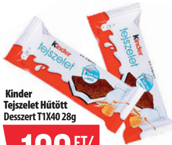
Kinder Tejszelet Hűtött Desszert T1X40 28g