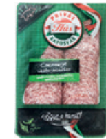
Privát Hús Csemege Vastagkolbász Vg. 60g, 7983Ft/kg