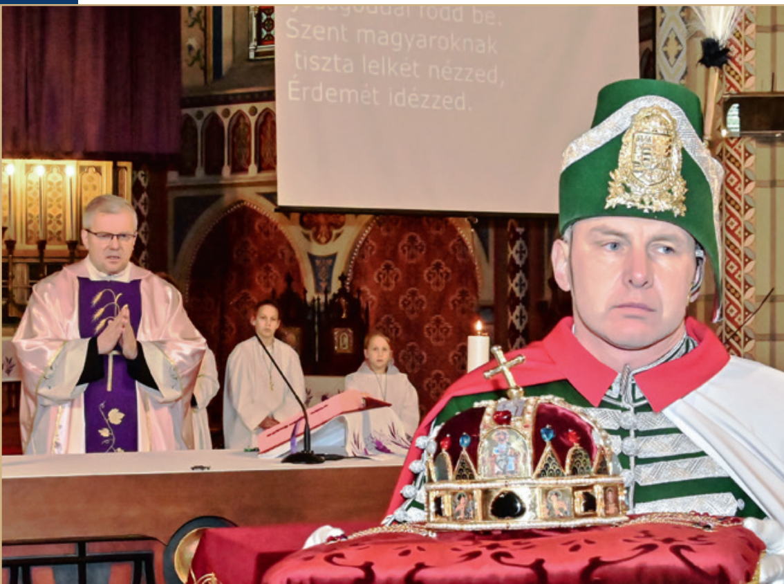
A Szent Korona másolata a Jézus Szíve-templomban

+36 30 181 2500 9700 Szombathely, 11-es huszár út 186. microweb.hu