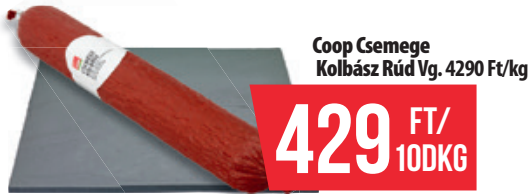
Coop Csemege Kolbász Rúd Vg. 4290 Ft/kg